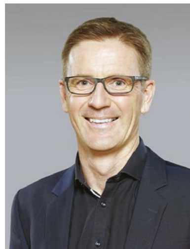
Alan Kearns Müller.