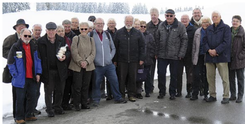
Jahresausflug mit Schneegestöber.