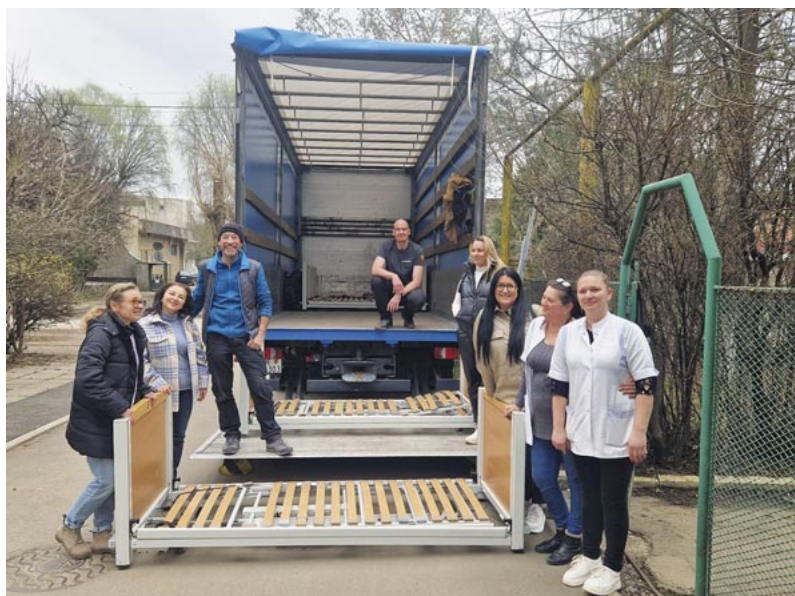
Ausladen der Betten in der Ukraine.