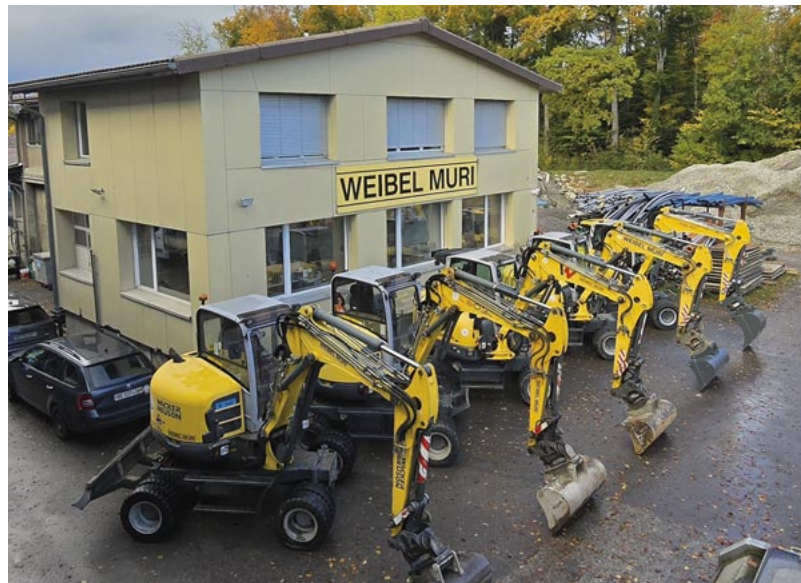
Der Sitz der Firma Weibel Muri AG im Tannental.

Die Firma Weibel Muri AG im Tannental feiert 2025 ihr 150-Jahr-Jubiläum. Seit mehr als 100 Jahren hat das Bauunternehmen seinen Firmensitz in der Gemeinde Muri bei Bern.