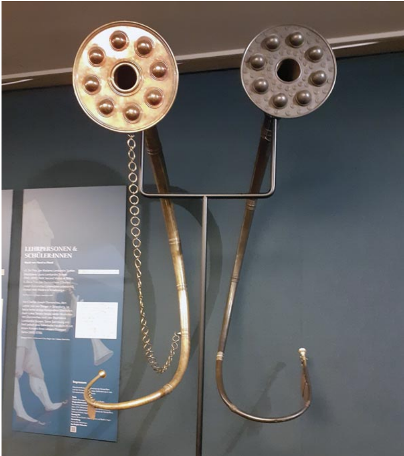
Viel Interessantes gibt es im «Klingenden Museum» zu entdecken.