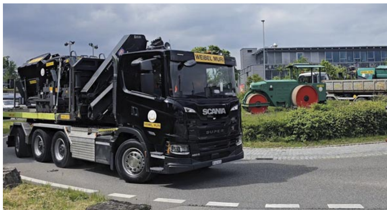
Der Kreisel an der Feldstrasse ganz im Zeichen der Weibel Muri AG.