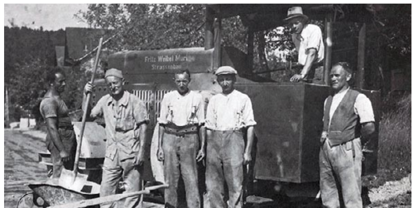
Arbeiter der Firma Weibel aus Muri an der Worbstrasse Gümligen. Die Aufnahme stammt aus dem Jahr 1936.