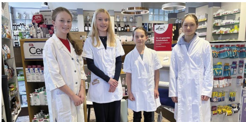
Das Schnuppern in der TopPharm Apotheke Neuenschwander in Gümligen machte Spass.